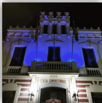
Canet de Mar