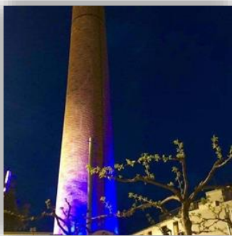
Premià de Dalt